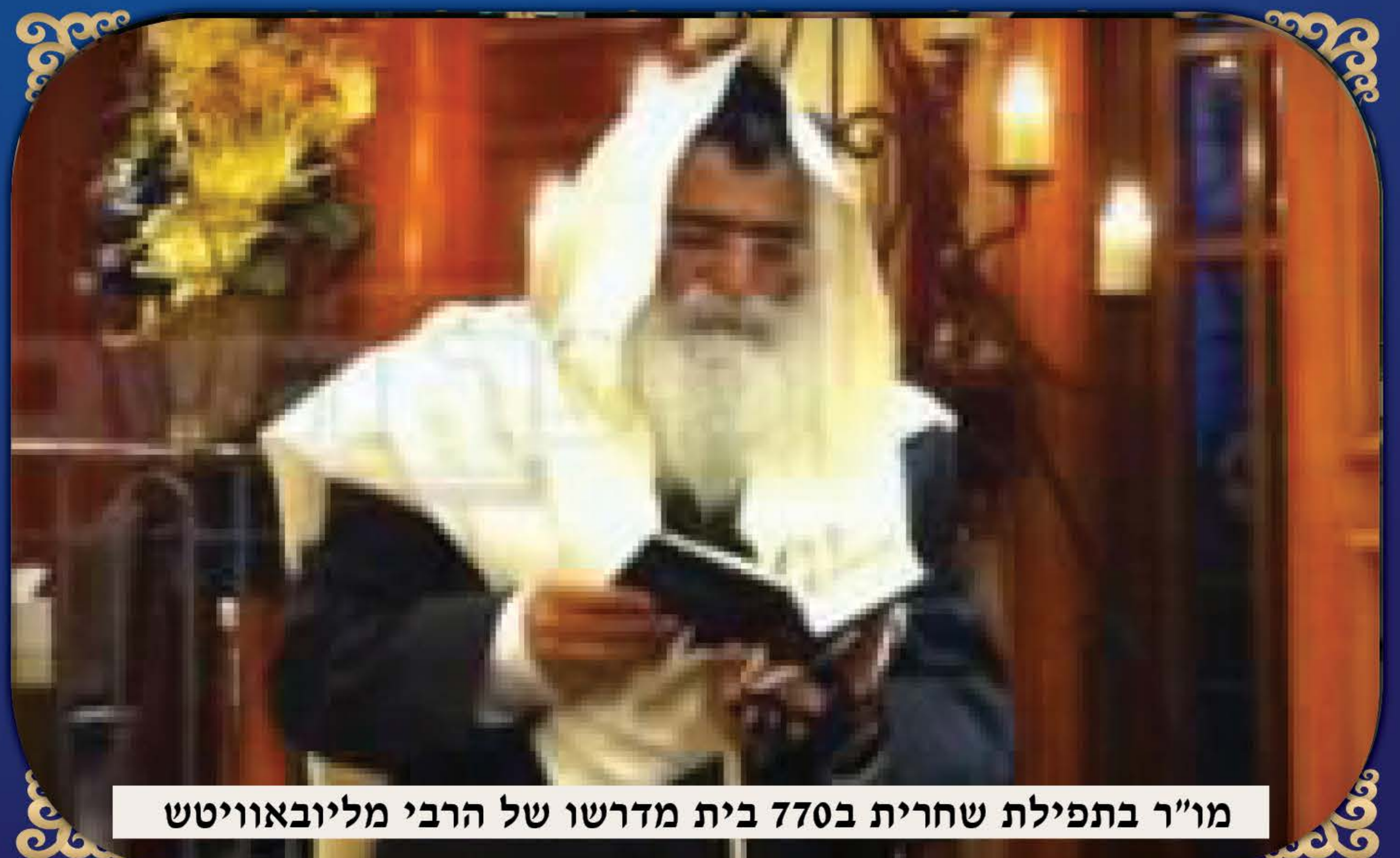
מו"ר בתפילת שחרית ב770 בית מדרשו של הרבי מליובאוויטש

פתאום שאל אותי בעל האולם: "יאמר לי כבוד הרב, איך היה טעמו של הדג שהוגש באולם?", וכדי שלא להביך את בעל האולם השבתי לו שטעמו של הדג היה משובח במיוחד, [הכוונה למי שאכל, שמסתמא מי שאכל הרגיש טעם משובח], הגם שבאמת לא טעמתי ממנו כלל. שמח בעל האולם ואמר בגאווה, "הטעם היחודי שיש בדג שלנו הוא בגלל שלאחר בישולו של הדג, ממש לפני שמגישים אותו לשולחנות, אנחנו מזלפים עליו מעט יין משובח יקר מאד שאני מביא מחוץ לארץ". וברגע זה שגילה בעל האולם את סוד טעמו של הדג שלו, לי התגלה סודה של אותה הרגשה שה' שלח לליבי למשוך את ידי מהדג, כיון שאותו יין שהיה בעל האולם מזלף על הדג היה יין נסך, וכך בחסדי שמים ניצלתי מאכילת מאכל אסור.