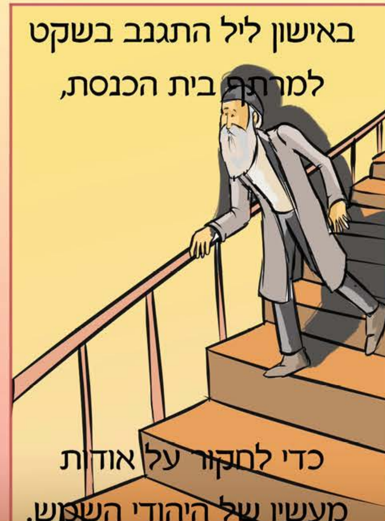
באישון ליל התגנב בשקט למרתח בית הכנסת,