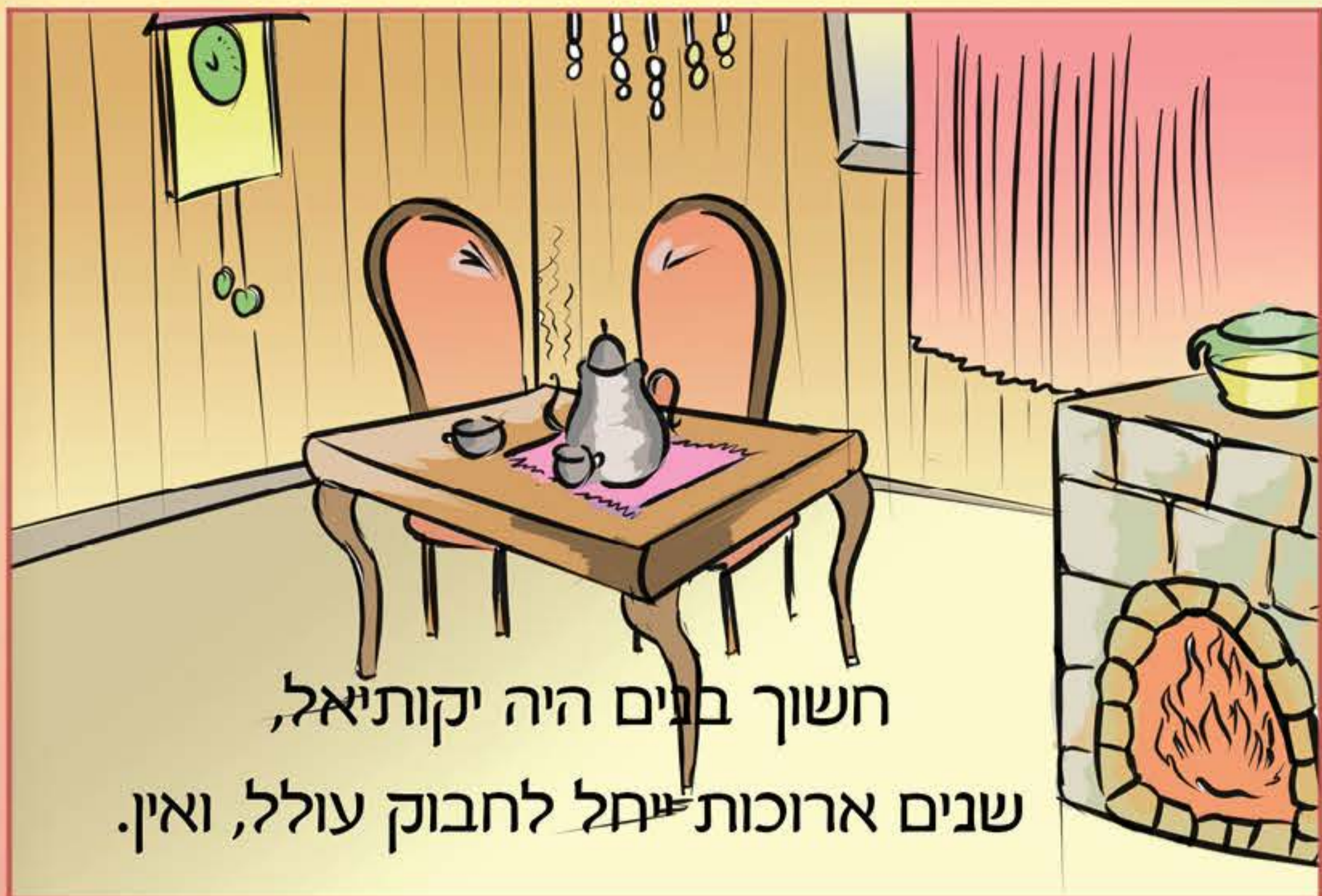
חשך בנים היה יקותיאל, שנים ארוכות יחל לחבוק עולל, ואין.