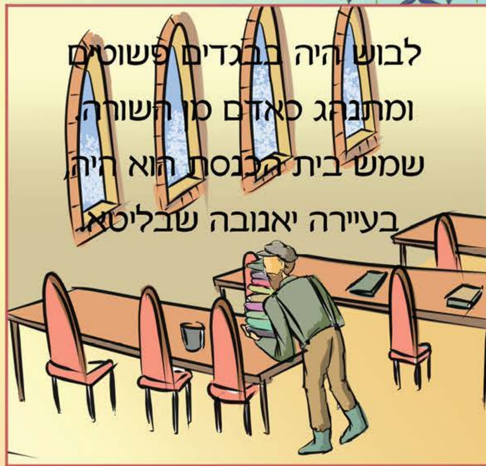
לבוש היה בבגדים פשוטים ומתנהג כאדם סו השורה. שמש בית הכנסת הוא היה בעיירה יאנובה שבליטא.